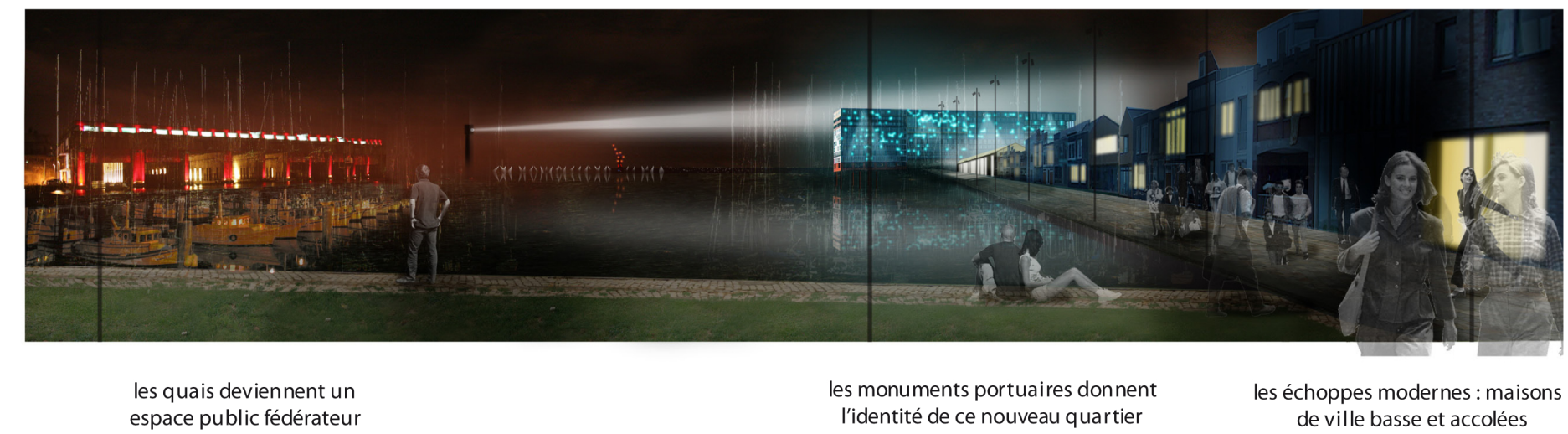
les quais deviennent un espace public fédérateur

RIVE DROITE : LES PIEDS DANS L'EAU A l'instar de la rive gauche et son miroir d'eau, le nouveau quartier des Marées, sur la rive droite de la Garonne, développe un nouveau rapport à l'eau. La création de canaux, de zones d'expansion des crues au pied des habitations ont été les conditions d'une réappropriation par les bordelais de l'élément aquatique. Les canaux du quartier des Marées sont devenus le lieu de baignade favori des habitants de la ville. Au dessus, les coteaux veillent sur la Garonne et se réjouissent de voir Bordeaux réuni autour de son fleuve [...] Direct Bordeaux 12 Juillet 2020