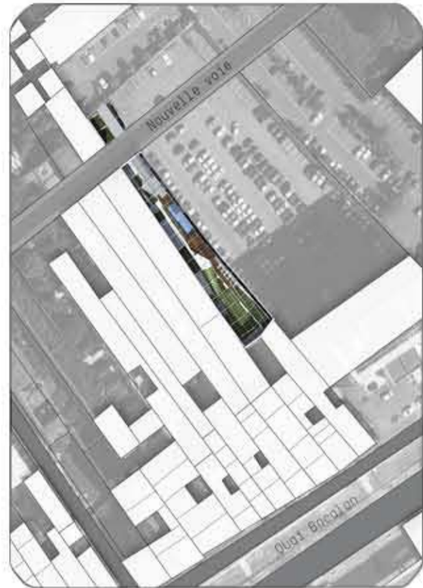
S'insérer au cœur des chais de Bordeaux