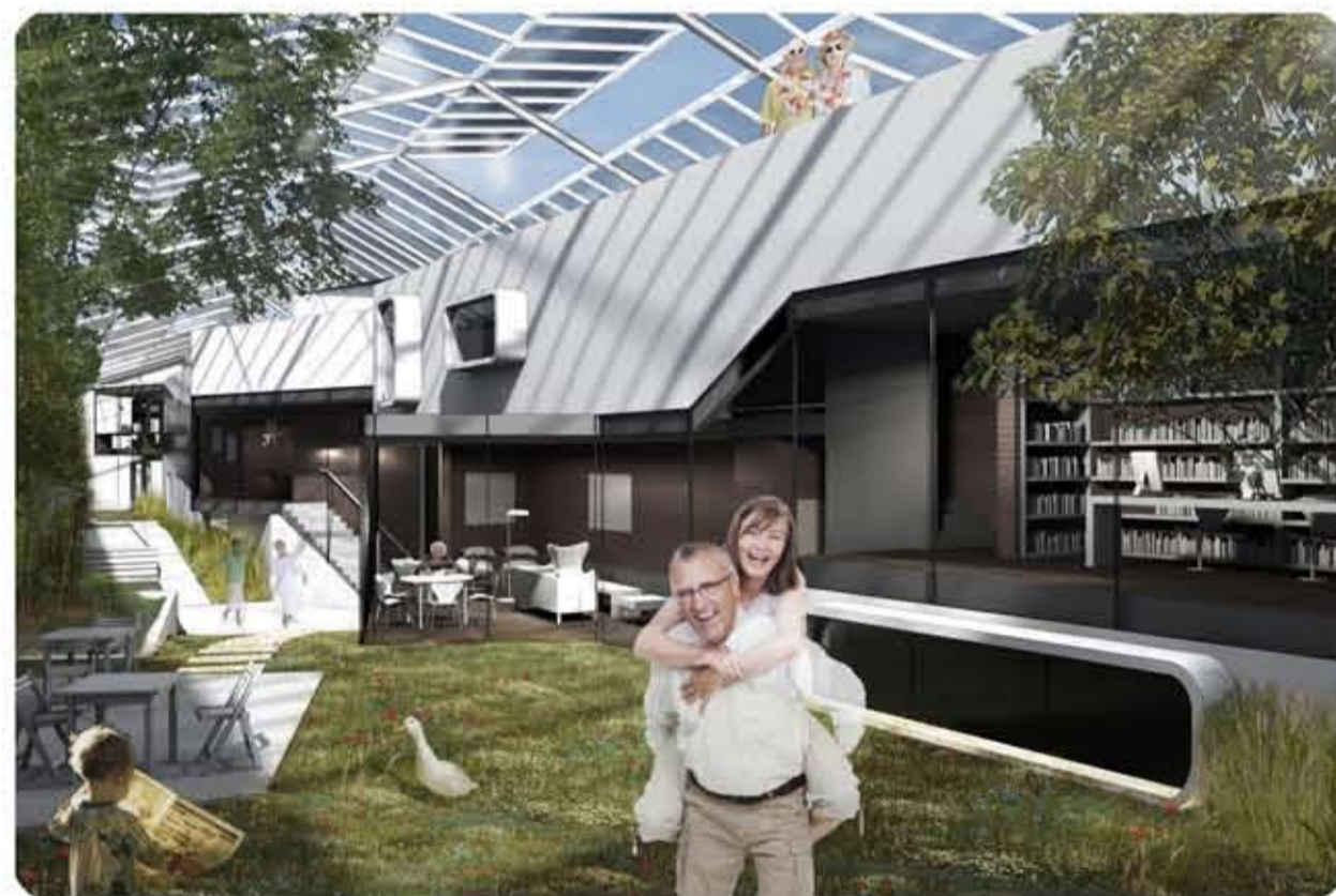
Les espaces communs ouverts sur le jardin