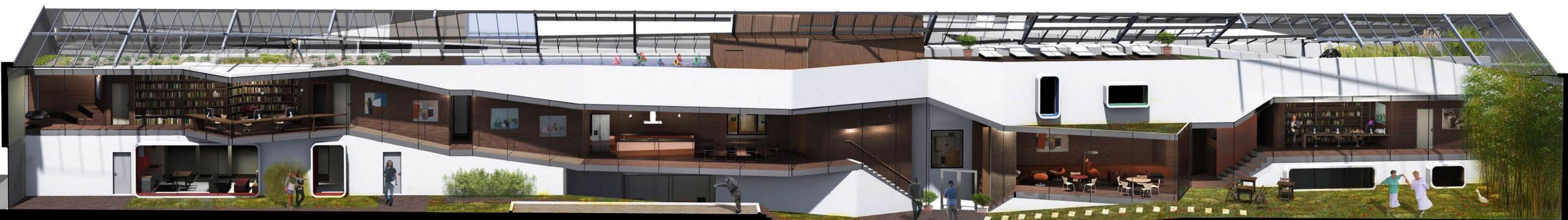
Coupe axonométrique 1/100 ème

Vieillir ensemble et autrement 1 maison / 6x2 personnes âgées, 1 étudiant, 1x4 invité, 1 artiste