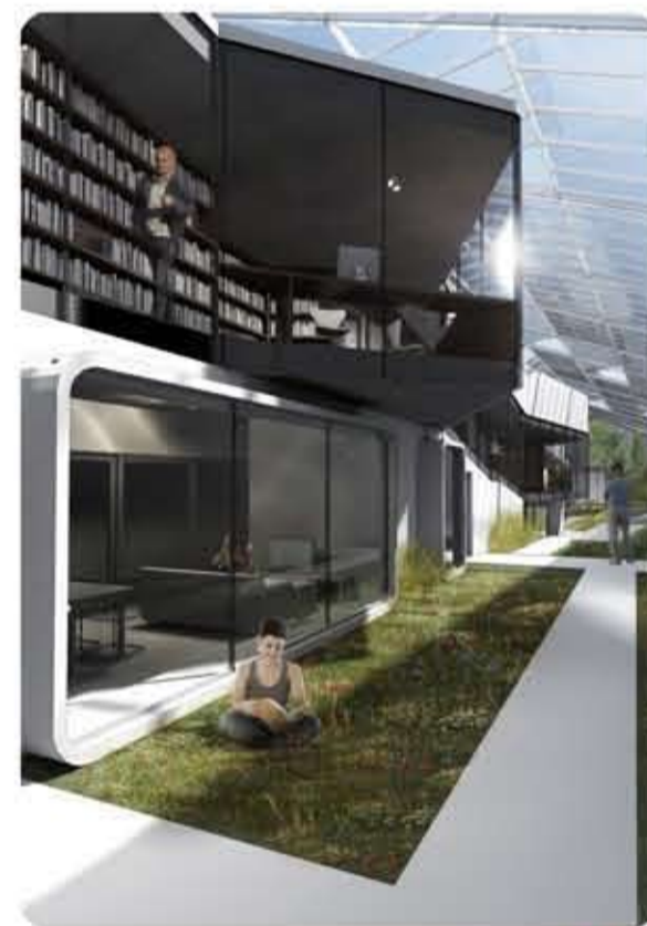
Concevoir l'esprit du chai