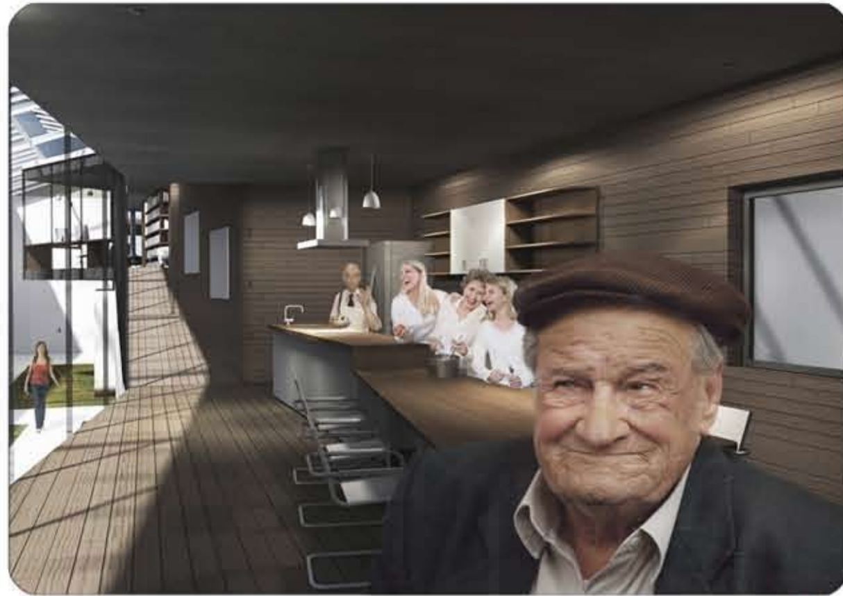
Une cuisine partagée