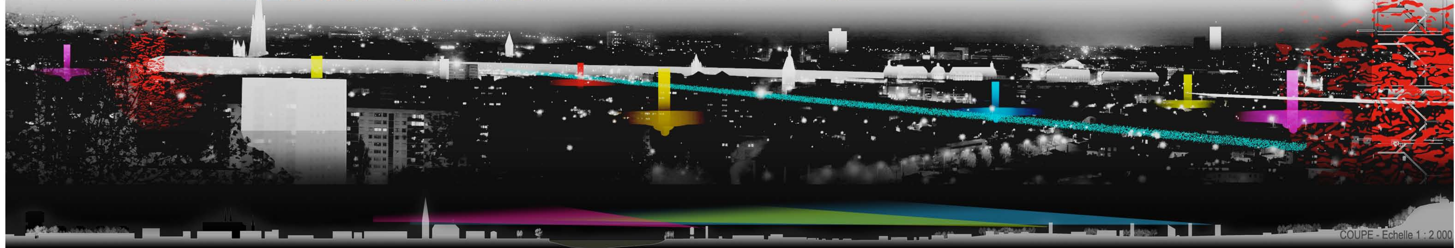
COUPE - Echelle 1 : 2 000