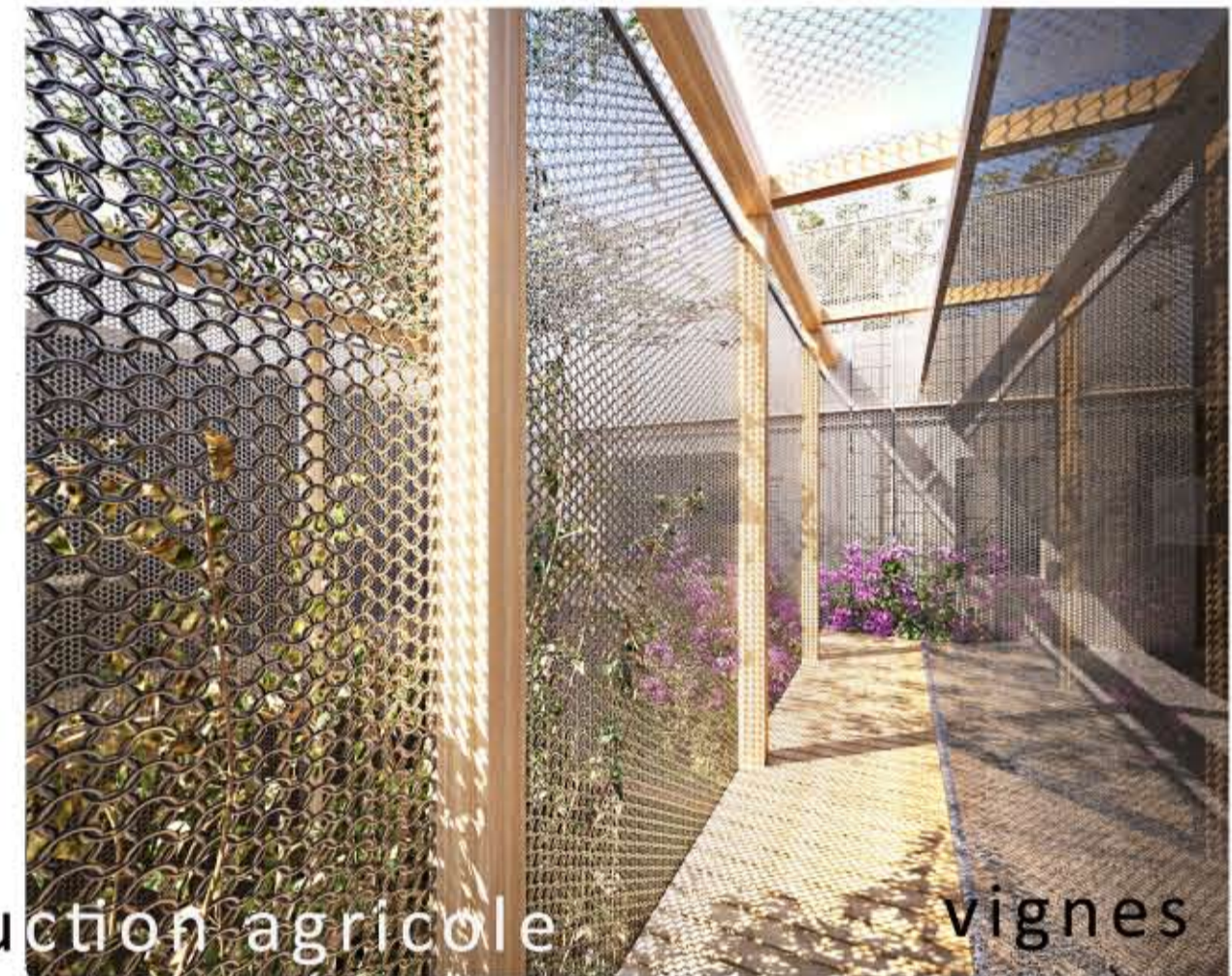
Double peau comme espace de production agricole