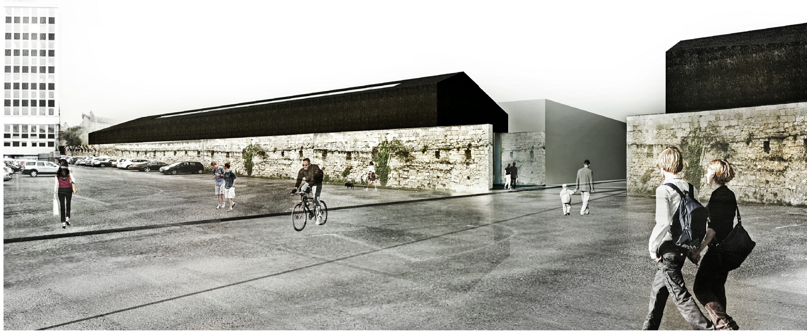
VUE DEPUIS LE PARKING