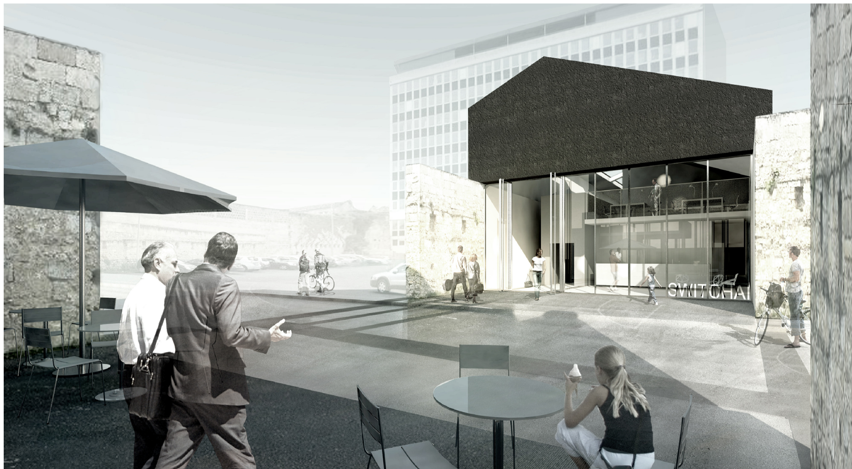
VUE DEPUIS LE PARVIS DU CAFE