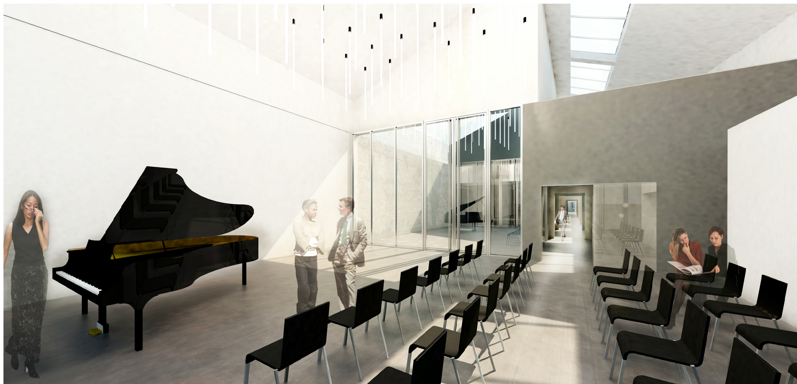
VUE DEPUIS LA SALLE POLYVALENTE