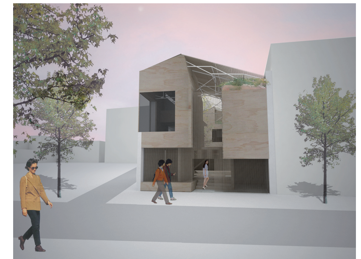
VUE DEPUIS LA VOIE NOUVELLE