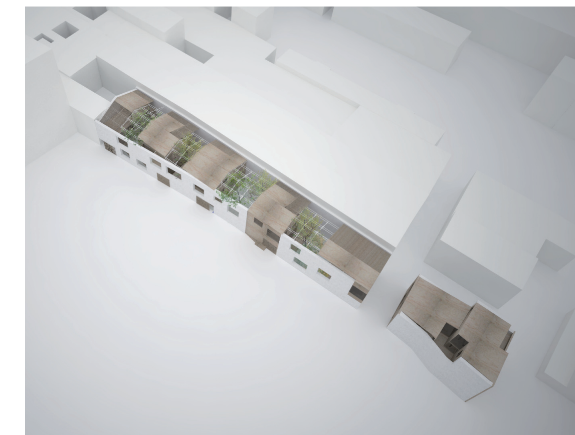
VUE AXONOMETRIQUE DU PROJET