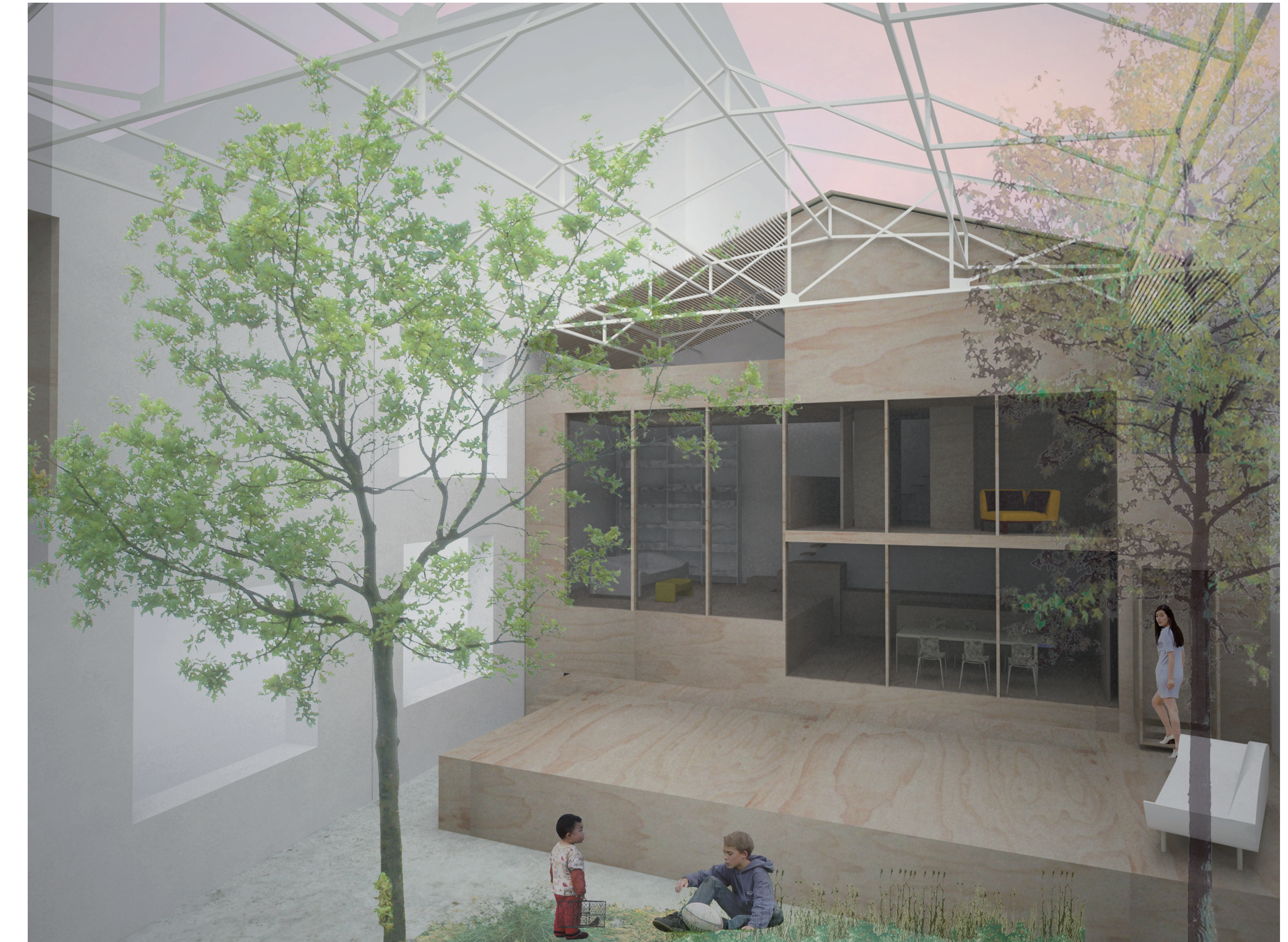
VUE INTERIEURE DU CHAIS