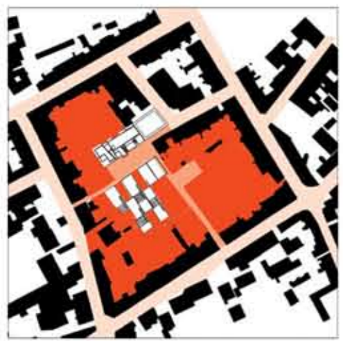
hiérarchie des espaces du public au privé