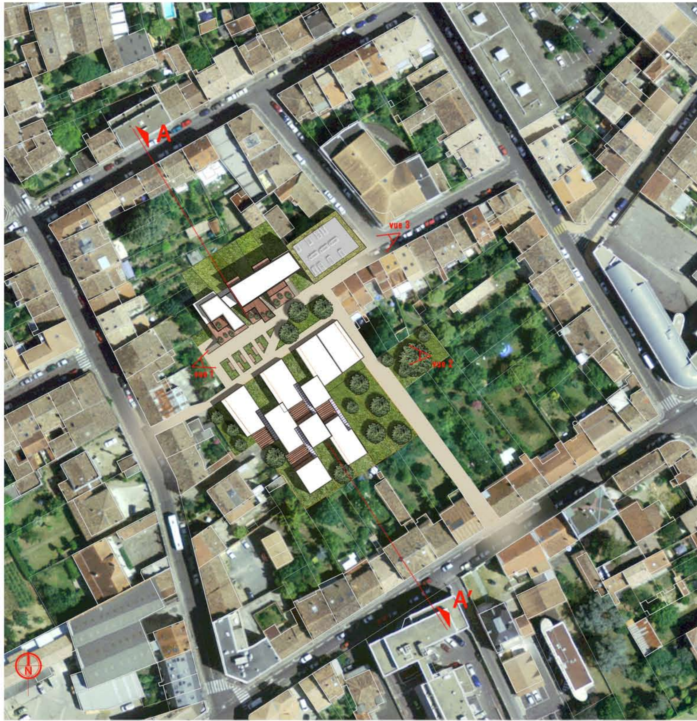
Plan masse éch. 1/500