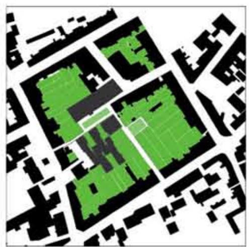
coeur végétal / couronne bâtie