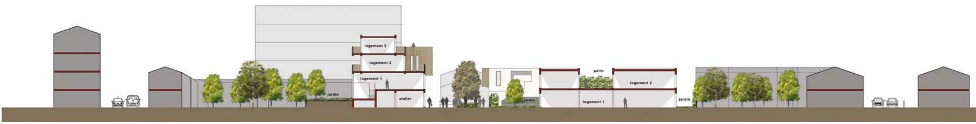
Coupe AA' éch. 1/250