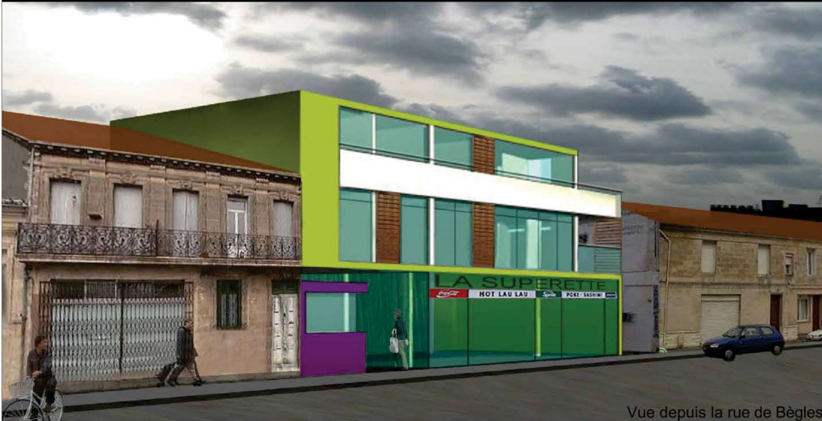
Vue depuis la rue de Bègles