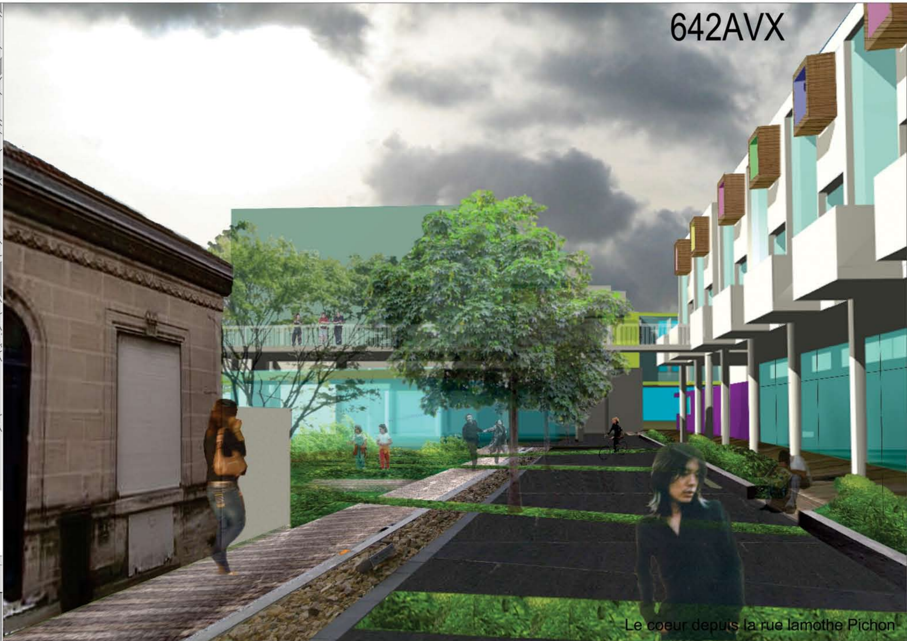
Le coeur depuis la rue Lamothe Pichon