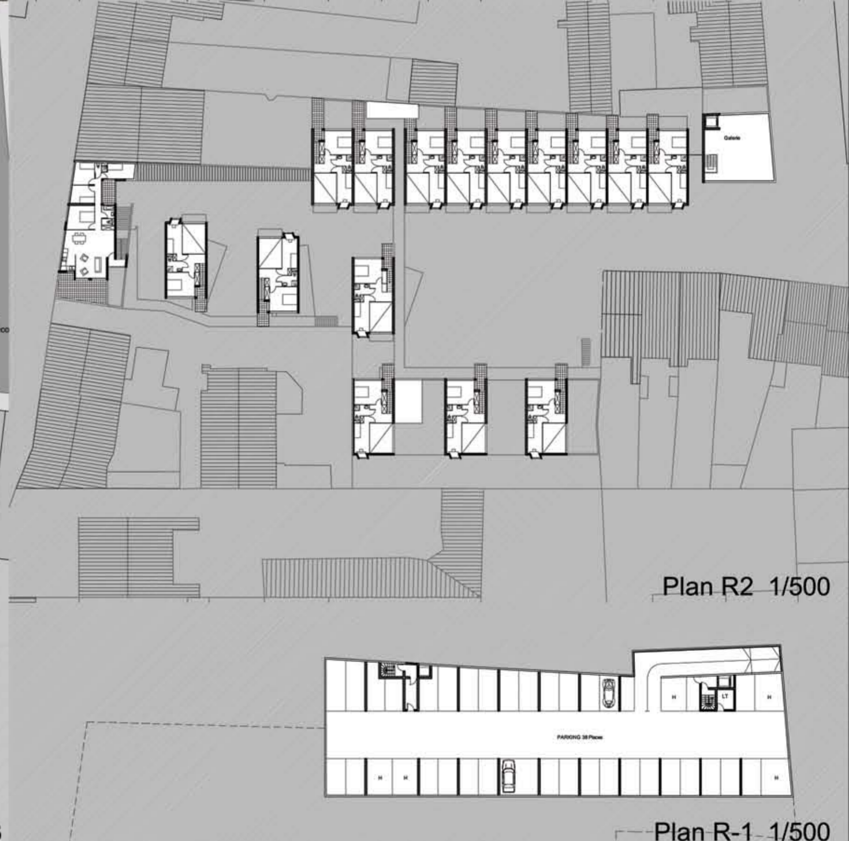
Plan R2 1/500