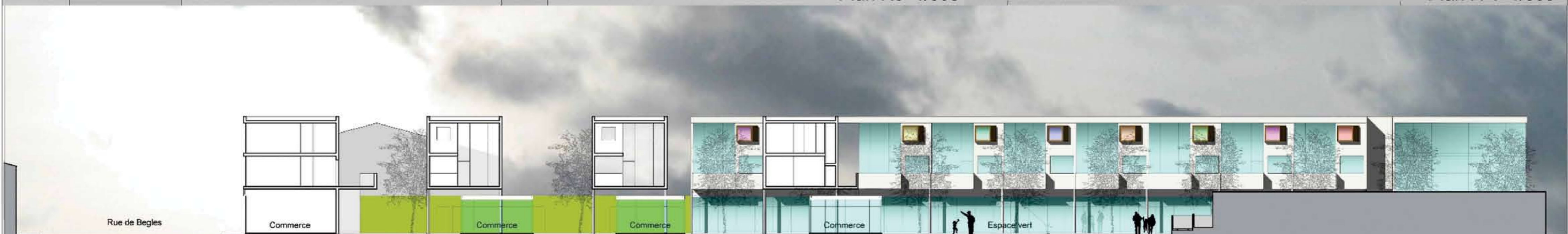
Coupe Longitudinale 1/500