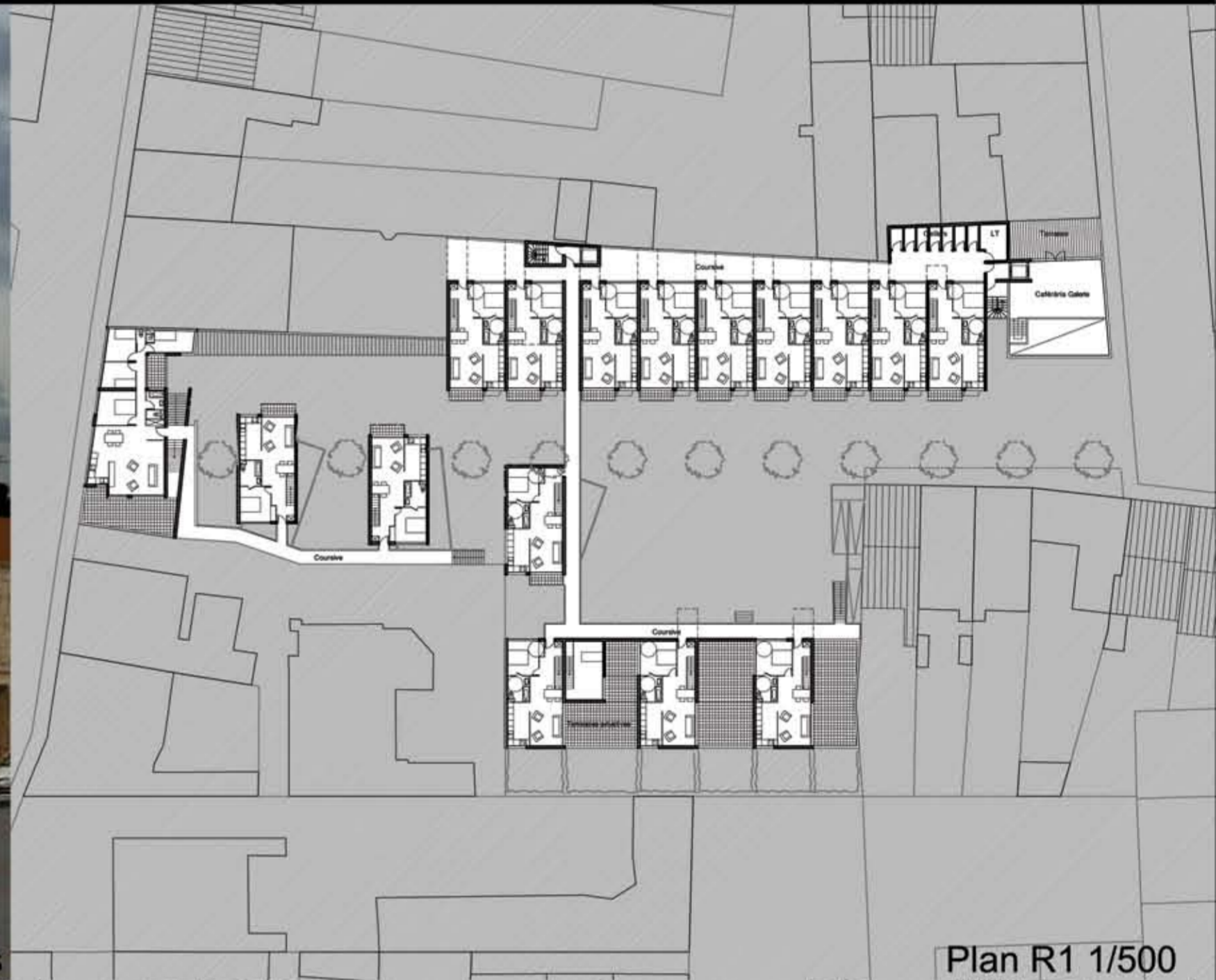
Plan R1 1/500