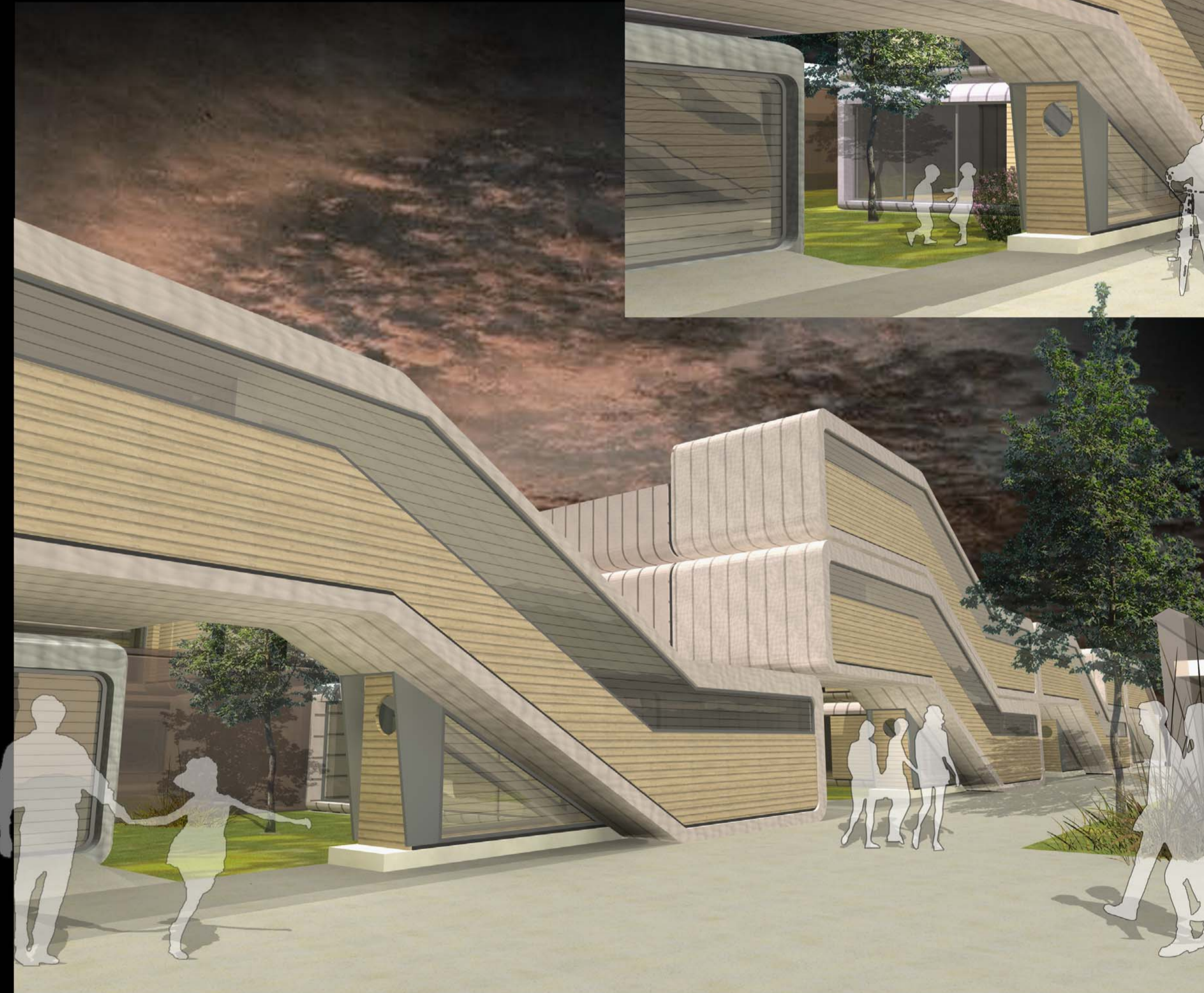
VUE DEPUIS UNE VENELLE