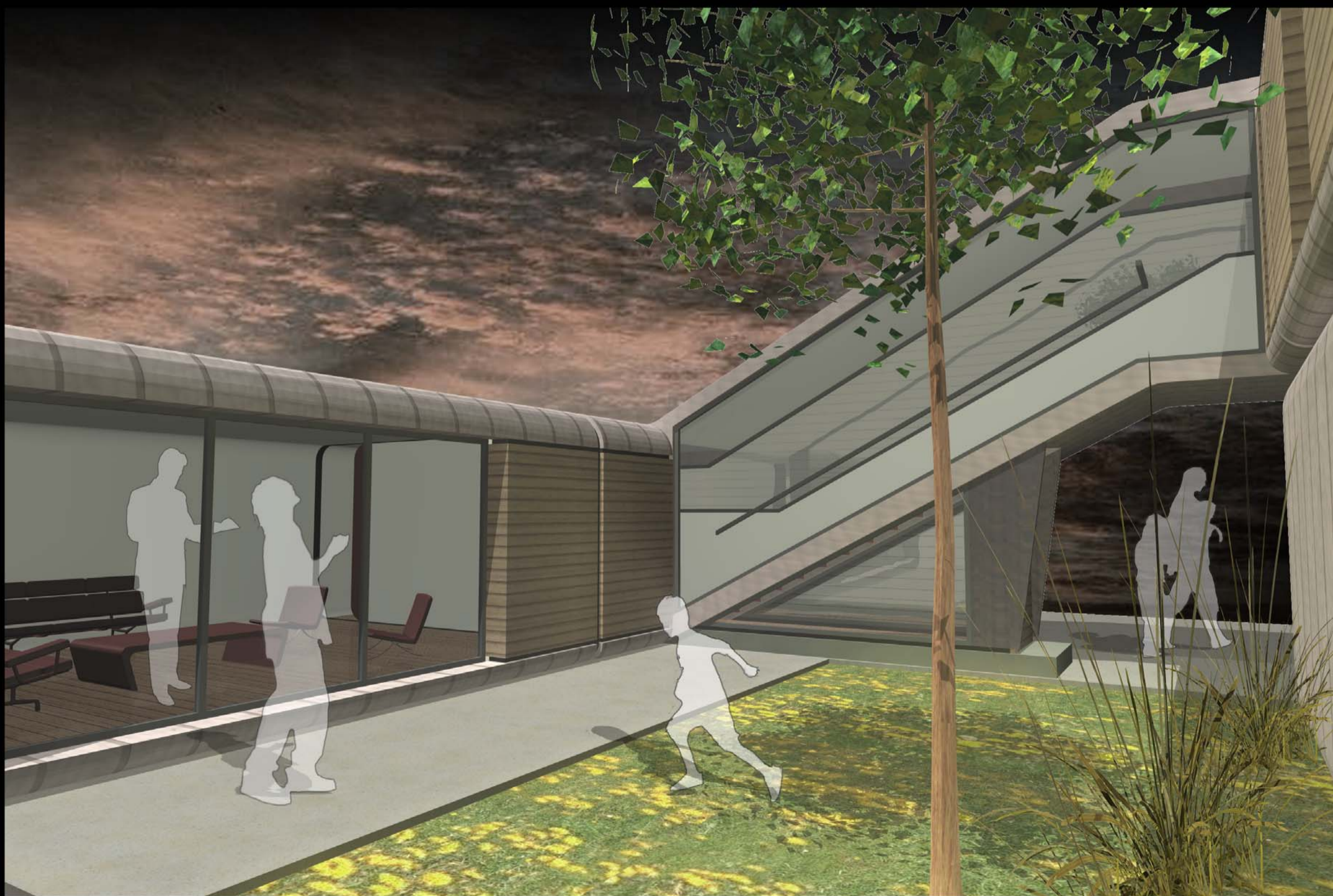
VUE DEPUIS UN PATIO