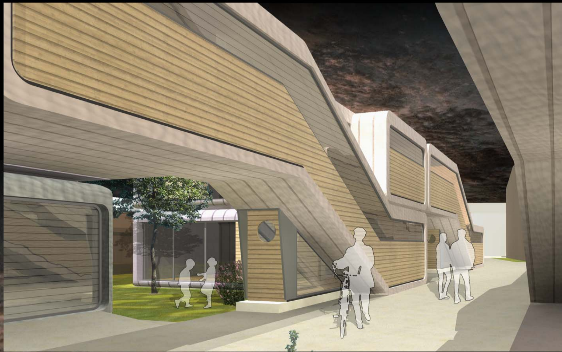
VUE DEPUIS UNE VENELLE