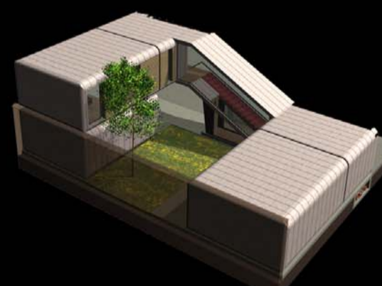
3 PIÈCES + GARAGE