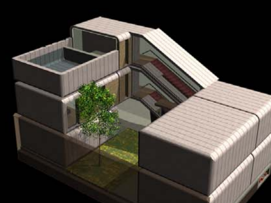
5 PIÈCES + GARAGE + PISCINE