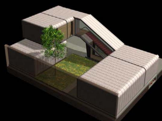
2 PIÈCES + GARAGE