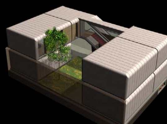
5 PIÈCES + GARAGE