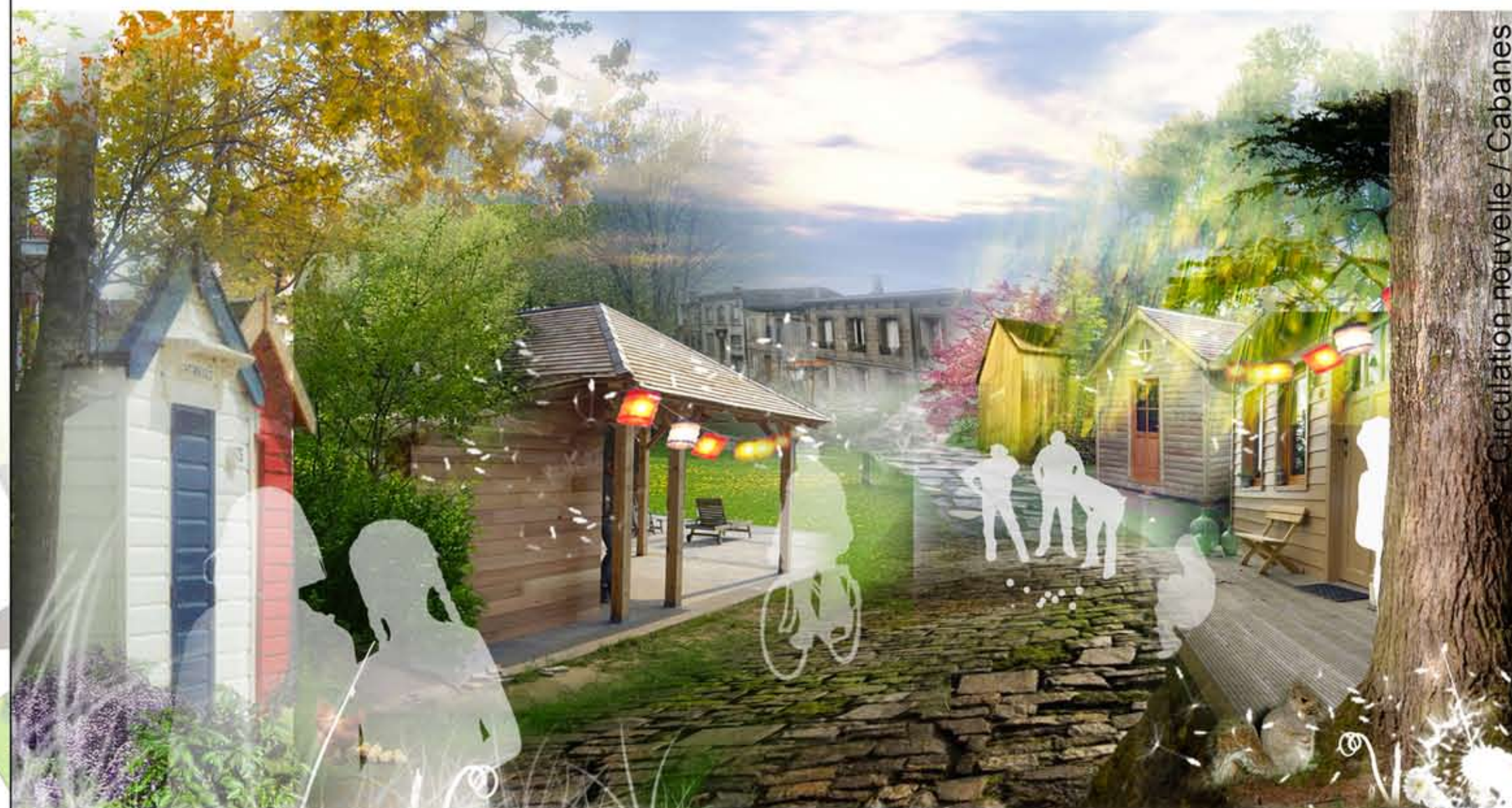
Circulation nouvelle / Cabanes