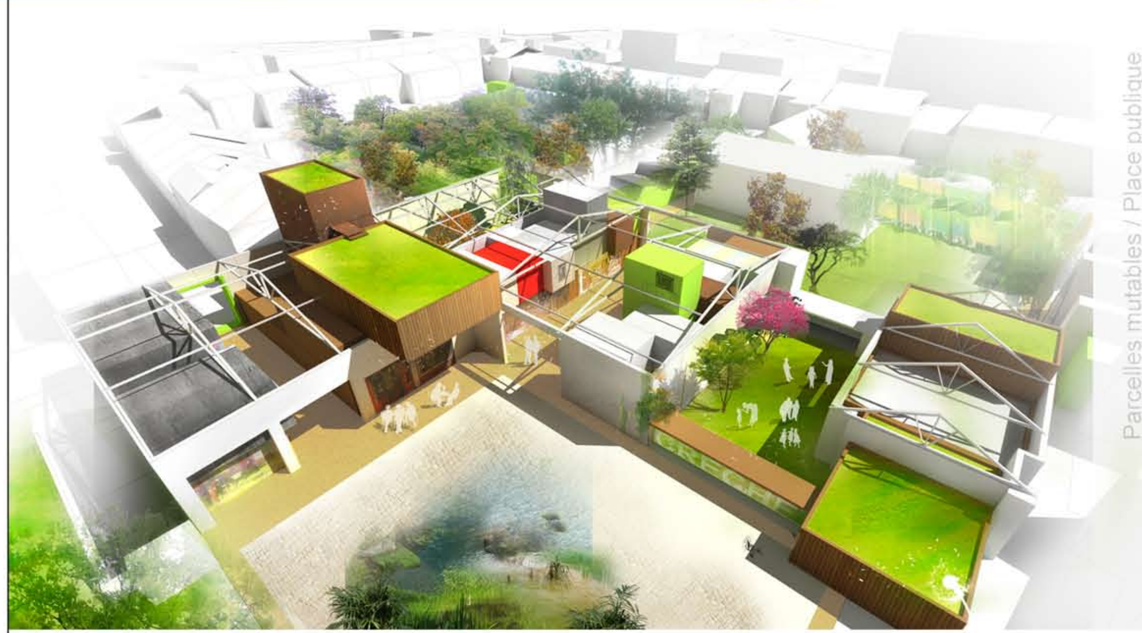
Parcelles mutables / Place publique