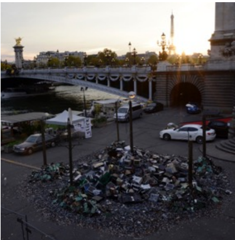
La motte de DEEE (déchets d'équipement électrique et électronique)

Vue de l'installation à Paris durant la foire Slick 10