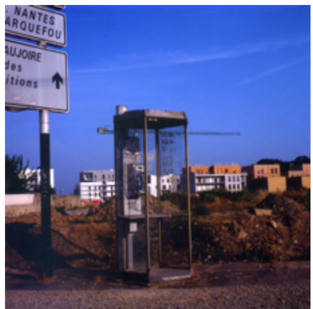
Guillaume Krick, Artefact (call cabin) , 2013