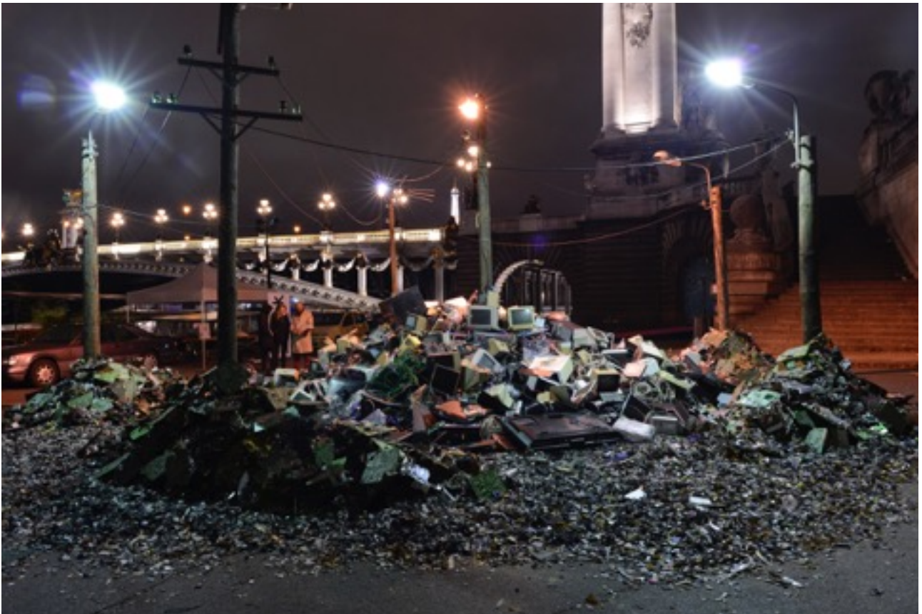
La motte de DEEE (déchets d'équipement électrique et électronique)

Vue de l'installation à Paris durant la foire Slick 10