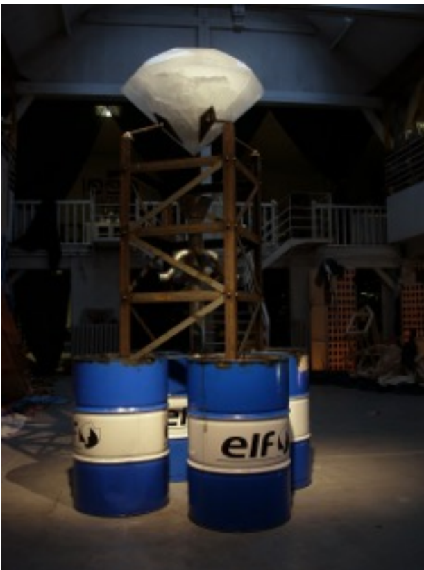
Guillaume Krick, Gisement exploitable , 2011