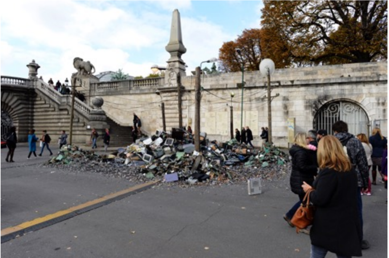
La motte de DEEE (déchets d'équipement électrique et électronique)

Vue de l'installation à Paris durant la foire Slick 10