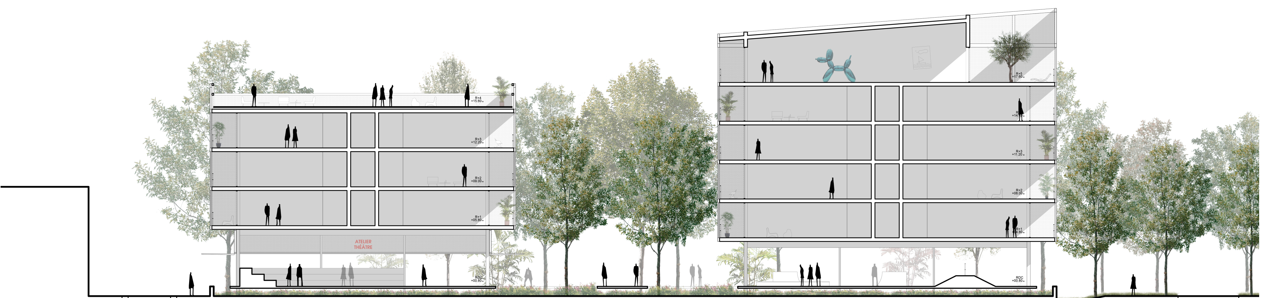
COUPE TRANSVERSALE 1:200

Nous avons souhaité ce projet comme une expérience unique qui propose un nouveau mode d'habiter écologique et social, suffisamment adaptable à nos besoins, nos exigences et nos usages. Il sera basé sur les valeurs d'un vivre ensemble, d'un partage d'espaces collectifs et paysagers connectés à une activité urbaine locale et sur l'aspiration d'une ville en accord avec son environnement.