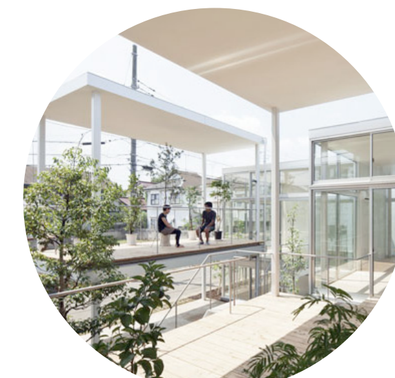
DES OUVERTURES NOMBREUSES QUI CADRENT SUR LE GRAND PARC