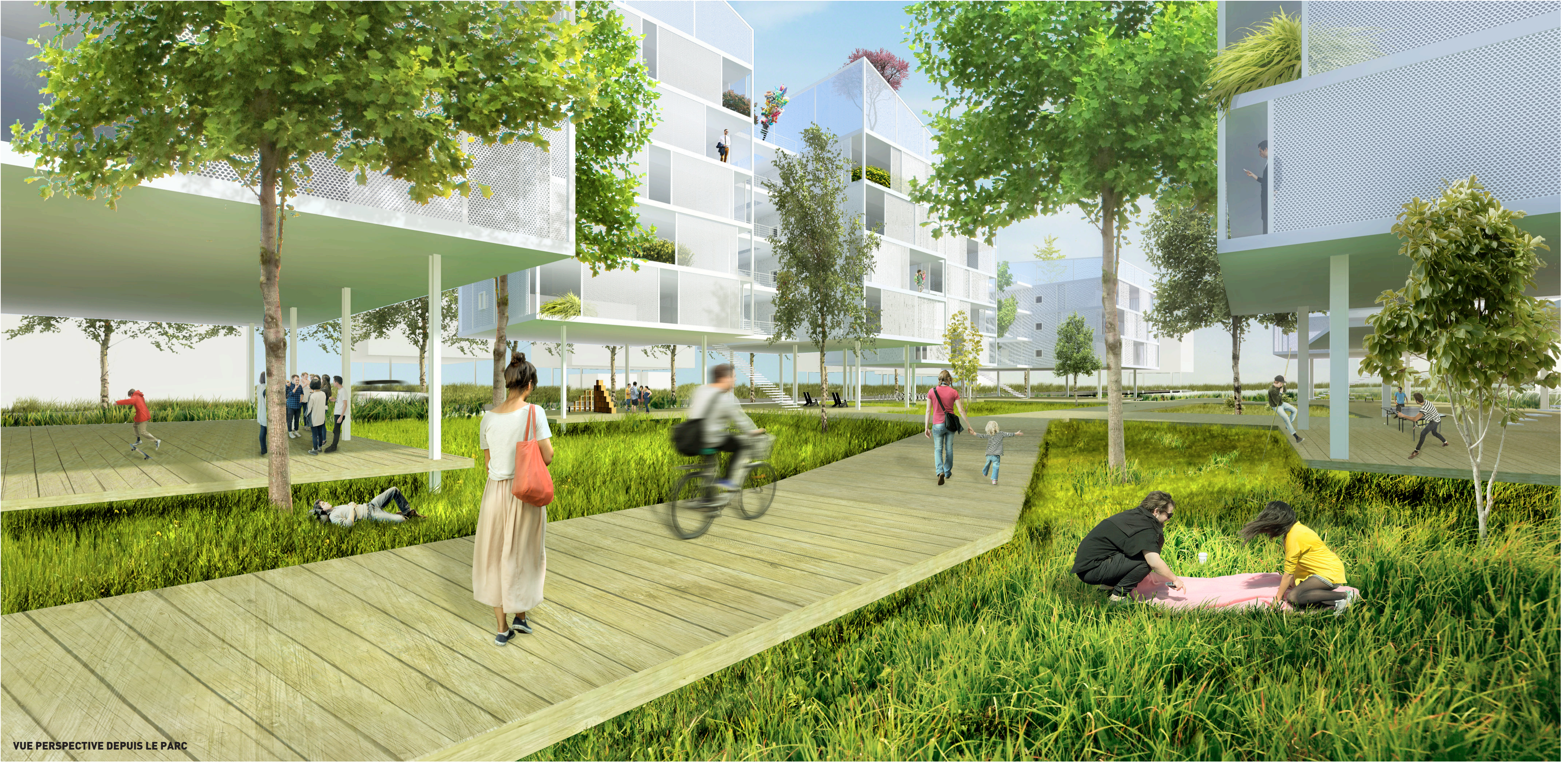
VUE PERSPECTIVE DEPUIS LE PARC