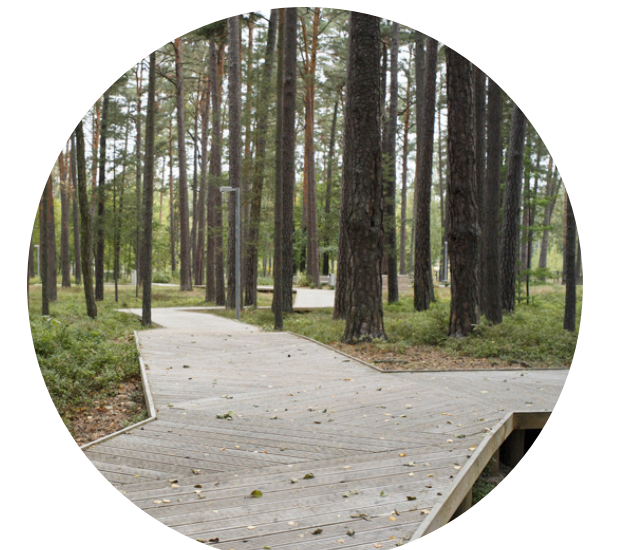
UNE PASSERELLE GÉNÉREUSE COMME COLONNE VERTÉBRALE DU PROJET