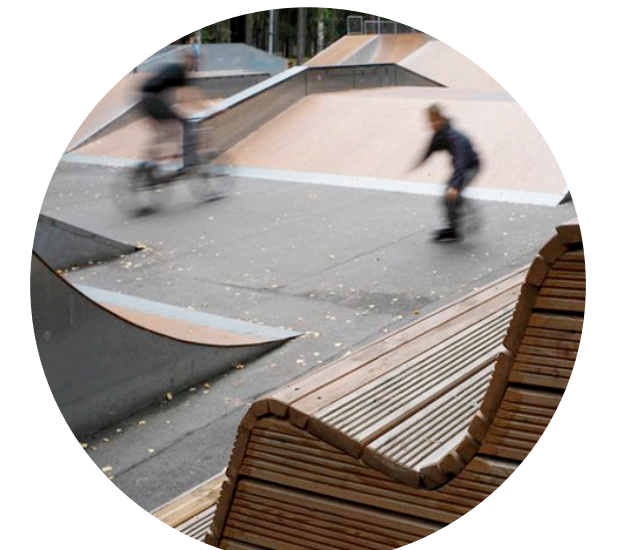
PENSER L'AMÉNAGEMENT D'ACTIVITÉS POUR CRÉER DU LIEN SOCIAL