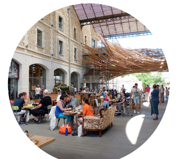
DES ESPACES COUVERTS ET CONVIVIAUX POUR LES HABITANTS

Ce projet s'installe dans un cadre fortement expérimental, visant à affirmer une nouvelle architecture écologique et contemporaine à travers l'utilisation du pilotis. Il permet ainsi d'offrir une nouvelle conception de l'habiter, dans un paysage, support d'un nouvel art de vivre ensemble. Ce projet expérimental se veut être un projet ouvert et évolutif, où l'architecture et le paysage composent un cadre de vie qui offre liberté d'appropriation des espaces et des jardins générant ainsi de la surprise, de l'imprévu et de la poésie. Les échanges et la solidarité ne se décrètent pas, ce nouveau mode de vie s'établit avec les habitants, qui imaginent selon leurs activités, leurs besoins et leurs envies, non seulement les usages des espaces partagés, la création des services communs, mais aussi les règles du jeu de gestion et d'utilisation.