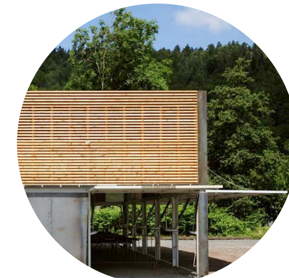
DES ESPACES MODULABLES EN FONCTION DES SAISONS ET DU CLIMAT

QUI GÈNÈRE DES PRATIQUES ET UNE DÉCLINAISON D'ESPACES PARTAGÉS ENTRE LES HABITANTS