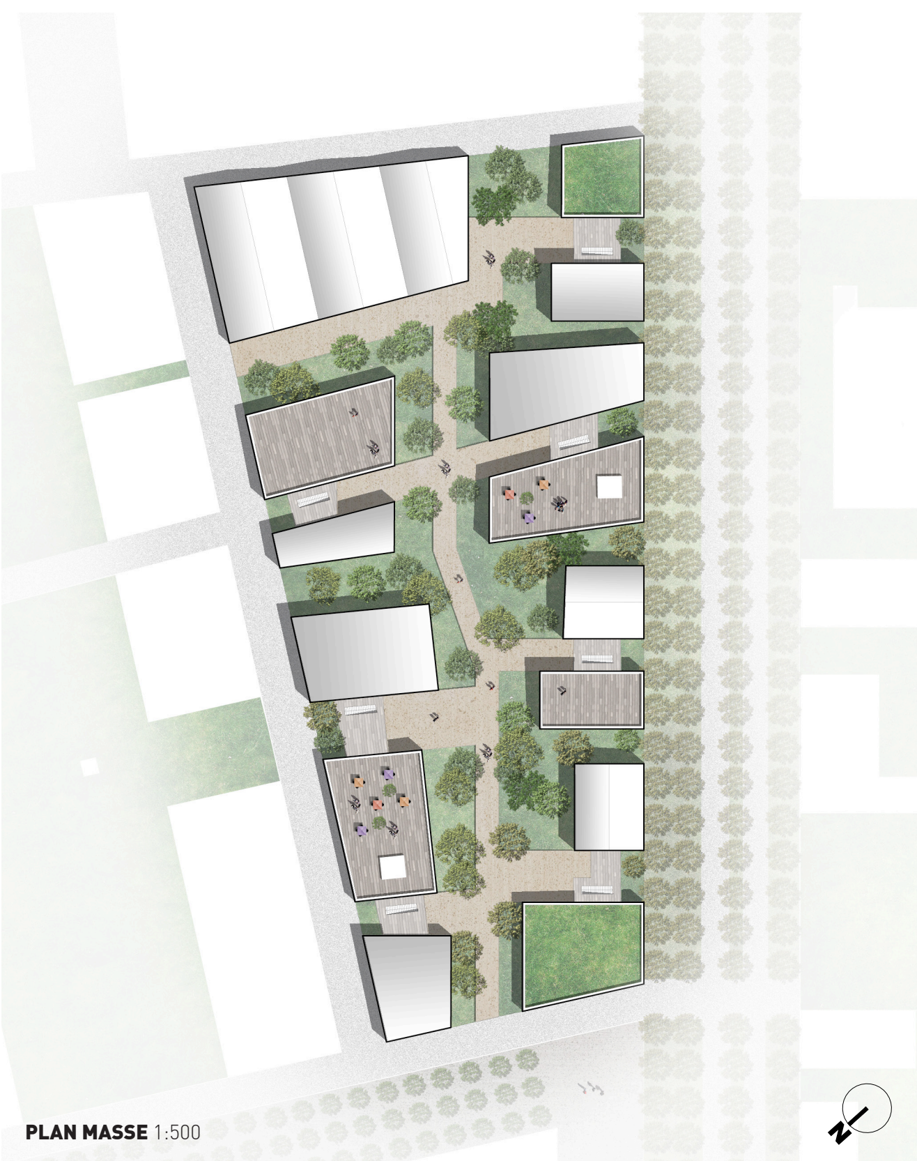
PLAN MASSE 1:500