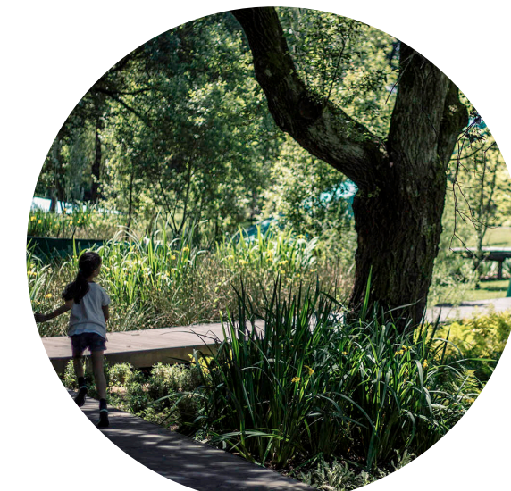
UN CONTACT PRIVILÉGIÉ AVEC LA NATURE ENVIRONNANTE